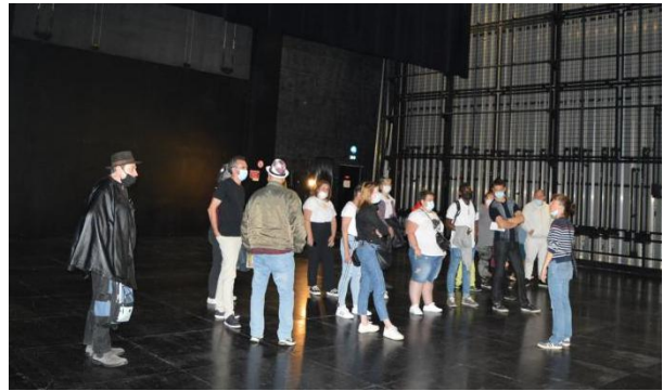
Visite à la Comédie de Béthune : lecture et découverte des coulisses du théâtre