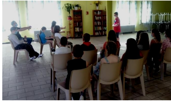
Ateliers théâtre avec les scolaires à l'école St. Exupéry et à l'espace G. Brassens