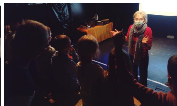
Séances musicales pédagogiques et courts métrages