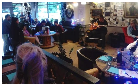
Théâtre et concert au Resto/bar la Diablotine