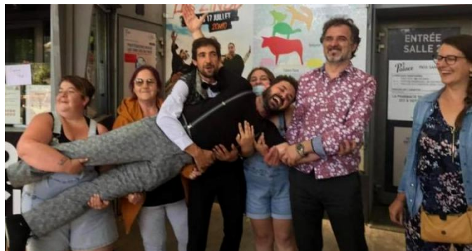
Visite d'un petit groupe du Secours Populaire de Nœux-les-Mines au Festival Off d'Avignon 2021