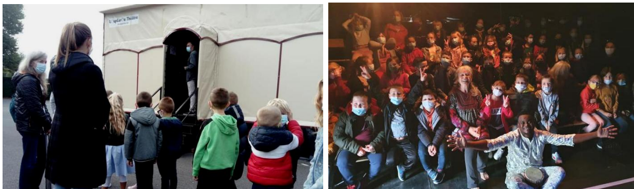
Installation du Loup Garou théâtre dans la cours d'une école : spectacles scolaires et tout public

En plus des élèves et des professeurs de l'école, le LoupGarou a également accueilli des spectateurs extérieurs à l'école lors de représentations données en soirée. Séances scolaires et séances tout public se sont ainsi enchaînées pendant les 9 jours du festival.