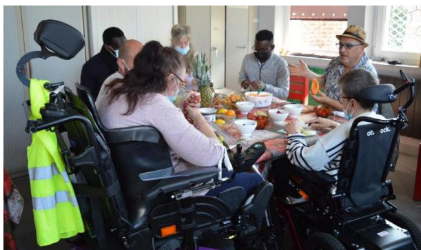
Théâtre à domicile à l'APF France Handicap et Atelier kuiZik avec un groupe d'usagers au SPF