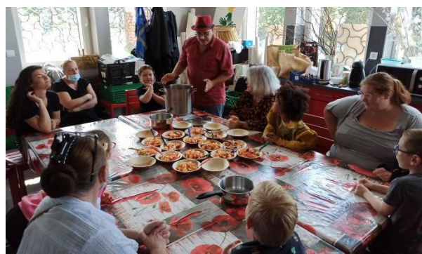
Participation du public : théâtre métal Est ce qu'on tue la vieille ? et atelier kuiZik