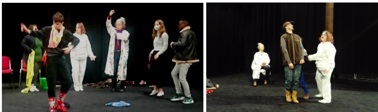
Répétition de la pièce La famille populaire créée par une bénévole avec l'appui des artistes de la Cie

Les résidences des mois de mai et juin ont été l'occasion pour la compagnie Libre d'Esprit de proposer des ateliers de théâtre au sein de l' École élémentaire Saint Exupéry et du centre de loisirs Croqu'École . Très positifs, ces premiers contacts ont amené de nouvelles perspectives pour l'édition 2021 du festival Dehors Dedans , notamment la possibilité d'installer le LoupGarou Théâtre (camion-théâtre mobile) dans la cour de l'école le temps du festival . De plus, ces ateliers scolaires ont permis de toucher un public plus large et d'ouvrir le projet au-delà du Secours Populaire de Noeux-les-Mines. En effet, des élèves de l'école Saint-Exupéry sont venus par la suite participer à plusieurs ateliers qui se sont déroulés au Centre socio-culturel Georges Brassens . La compagnie a également rencontré l'équipe du Lycée Polyvalent d'Artois en juin et est entrée en contact avec le collège Anatole France.